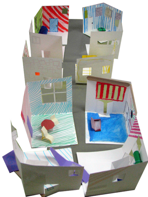
1, 2, 3, 4, 5 y 6: talleres de arquitectura y arte para niños

Patrocinada por el Ayuntamiento de Pontevedra y la Diputación de Pontevedra.